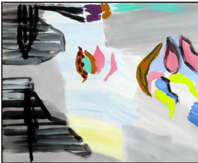
Vers les lueurs, 46 x 55, acrylique sur toile, 2013