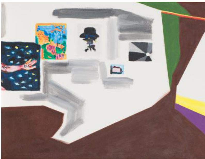
Cécile Degouy, «Hommages»(détail), 2013, Acrylique sur toile 46 x 55 cm

Exposition visible du lundi au vendredi de 9h à 12h et de 14h à 18h fermée le 10 et le 11 novembre.