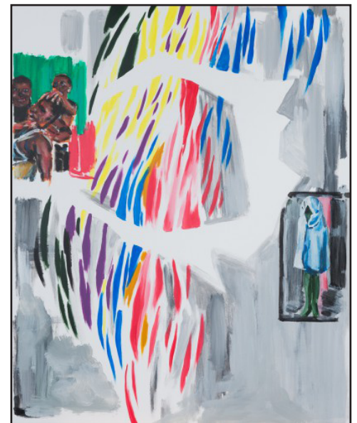
Et ainsi va l'Afrique, 80 x 100, acrylique sur toile, 2013